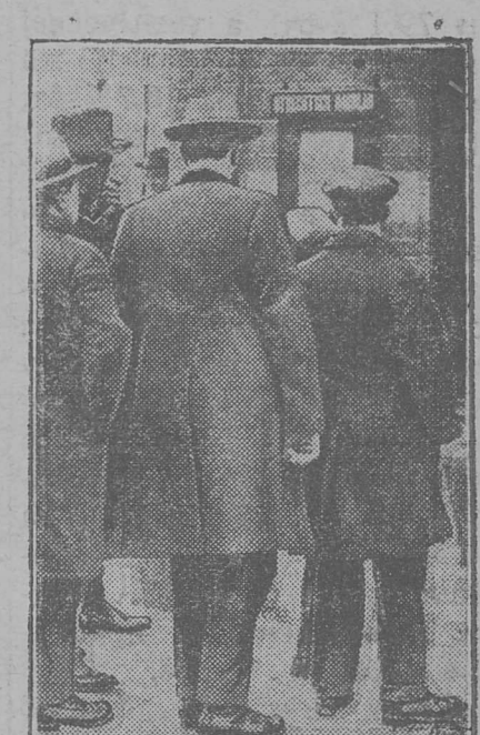
Голандїјаса „Утрөкт даґбаат“ газетөн Францїја да Бельґа-көст војнеңөј гуөа доґовор јөздөм јона шычөдїс Германїяөс да Голандїяөс, тајө доґоворıs мед-војдөр налы паныд лөсөдөма-да. Карїна-кылын: „Утрөкт даґбаат“ редактїя-воңын вельтөс-мунне лыкөбны јөздөм гуөа доґоворıs.

дөрт, абу лада. Америкаыс ачыс сенї мыґа, ачыс кык-боксаң заводїтлїс топөдны СССР сө (Көрдөрын дај Гїбырын). джонсон индө, СССР пө ачыс вермас Америкалы корны војна-дырї вөчөм убыткајасөс вештыны. джонсон шөктө Сојөдїноннеј Штатјас-көстлїс конференцїя СССР-са прөдставїтөлјасөс корлөдөн, сорнїтны сенї тајө государствөсјас-көстас волысөм лөсөдөм-јылыс.