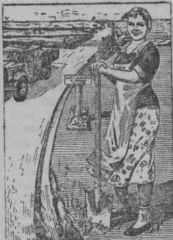
КОЛХОЗНАЯ ДОРОЖНАЯ БРИГАДА — ЛУЧШАЯ ФОРМА УЧАСТИЯ СЕЛЬСКОГО НАСЕЛЕНИЯ В СТРОИТЕЛЬСТВЕ И РЕМОНТЕ ДОРОГ

Художник В. Костинлөн плакат, кодөс лөдзөма „Искусство“ издательствоын.