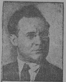
Президиумса секретар А. Ф. Горкин