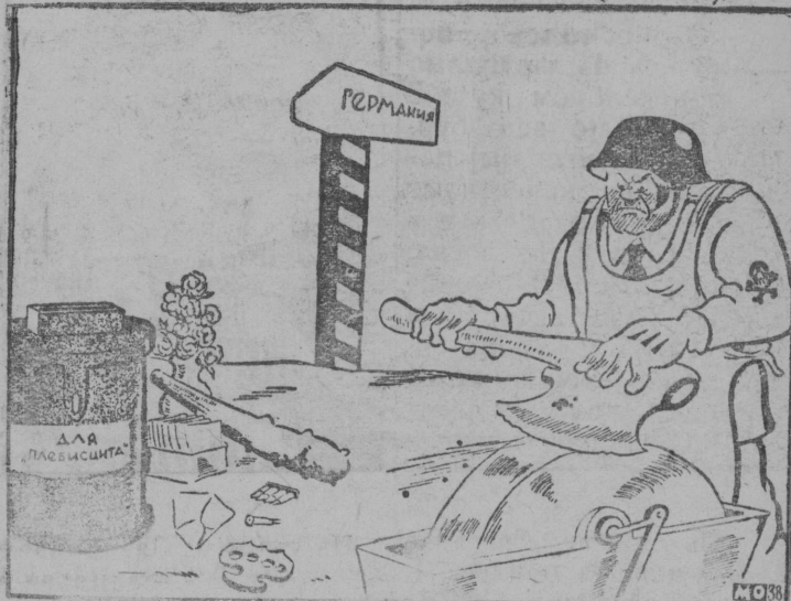
Подготовка к очередному „плебисциту“. Рис. М. Отарова („Прессклише“).

Проведеннї германсыямы фашистами при помощи террора и обмана „плебисцит“ в Австрии имел целью не только оправдать аннексию Австрии, но и будущие захватнические планы фашистской Германии. (Из газет).