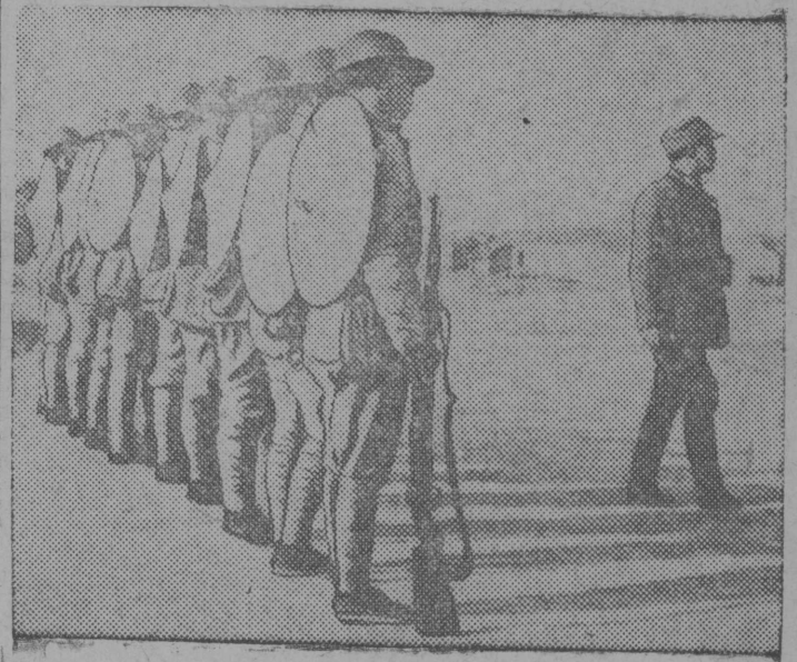
На сн.. Отряд бойцов китайской армии проходит боевое обучение.