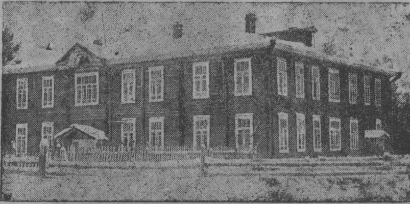
Снимок вылын: Помöднса леспромхозучлөн школа зданије.