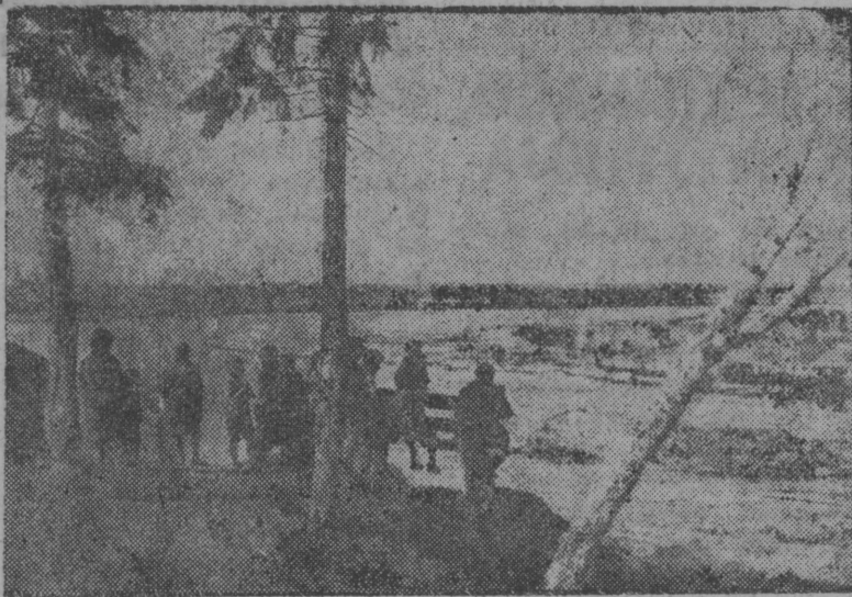
Сыктыв ју јі кывтігөн (Сыктывкар еест).