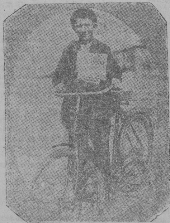
Снiмөк вьлыны: Комсомолец-пiомоносегiа. Мiх. Мө-ровов. Бура удалöмыс сiдö боотлiс-нiн 2 премiя (Пустош).