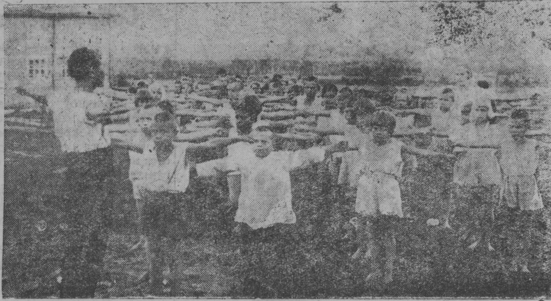
Сувтис санаторијлөн лун! Санаторијаын шөйтчыс пионерјас организованиөја петисны площадка вьлө. Начинај! — команда серуи пионерјас вөчөны физкультурнөј зарядка. Снимок вьлын: Береговса санаторијын шөйтчыс пионерјас физзарядка вьлын (1934 воца снимок).

Налыс примерсө колө бөстны и мукөд рајкомјаслы.