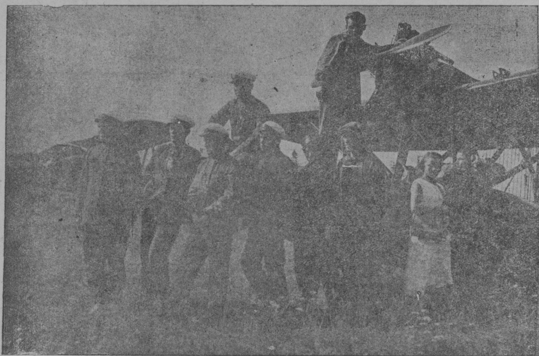
Снімок вылын: Сяктыварса аэродром вылын местной авіаотрадаён лётной состав.