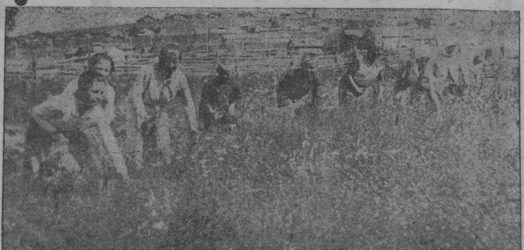
СҢИМОК ВЫЛЫН: Појолса пїонерјас колхозлы отсаөбны шабдї нещкөмын.

бөда сїктөсөвет, Сыктывдїн р.) кыскөма уголовнөј кывкутөмө. Материалсө следствїебн помалөма да сөтөма сүдөбнөј органјасө Сурвасевөс сүдїтөм вылө. Областувса прокурорлөн помошшїк І. Попов.