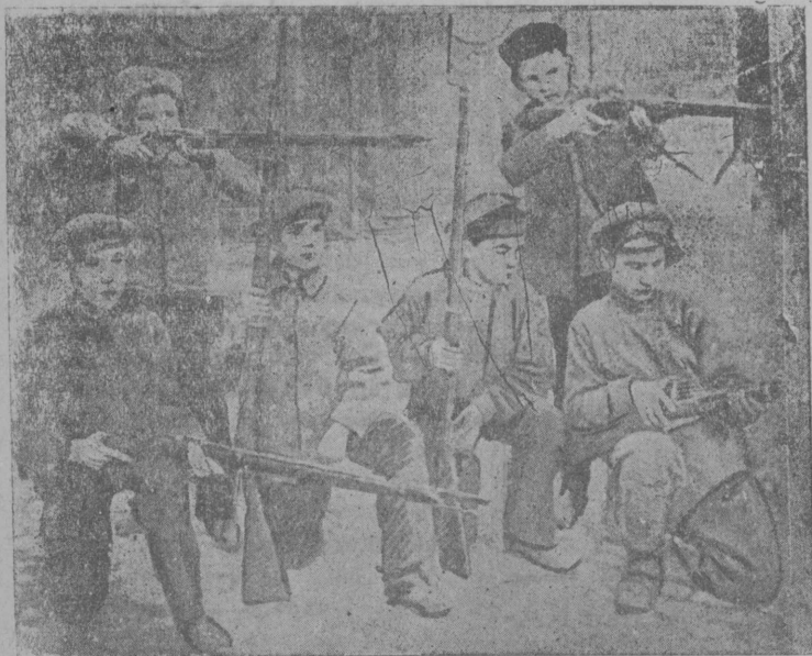
Республика сулалїс ружїебн... Комсомольцїас да томјоз муналїсны партизанскї отрадјасд да Красној арміја.

Неуна бдымыштїм, Сдбштїс вын, Комсомол ас радас бостїс. Кывтїсны лувјас, Окмыс вожын— Мїжансб школаб еетїс. Велдчїм... Бырї ас сїкт всна гаж, Важ јортјасдс вїдлыны мбдї. (Ег пыжбн, *) Шуавлїсны. **) Шыбалїм, лылїм. ***) Кулды— јона лачкды нї-тдны.