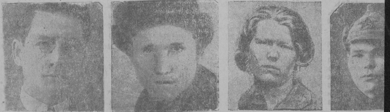
Слїшоҳ выдмын мїжан организацијамо знатнї јдс: проф. Пїунырев—воотїс ујездывса первої сїезд; К комсомольскї, поет, онї Красној арміяын, Ів. Трошев бригадїр, Јелж