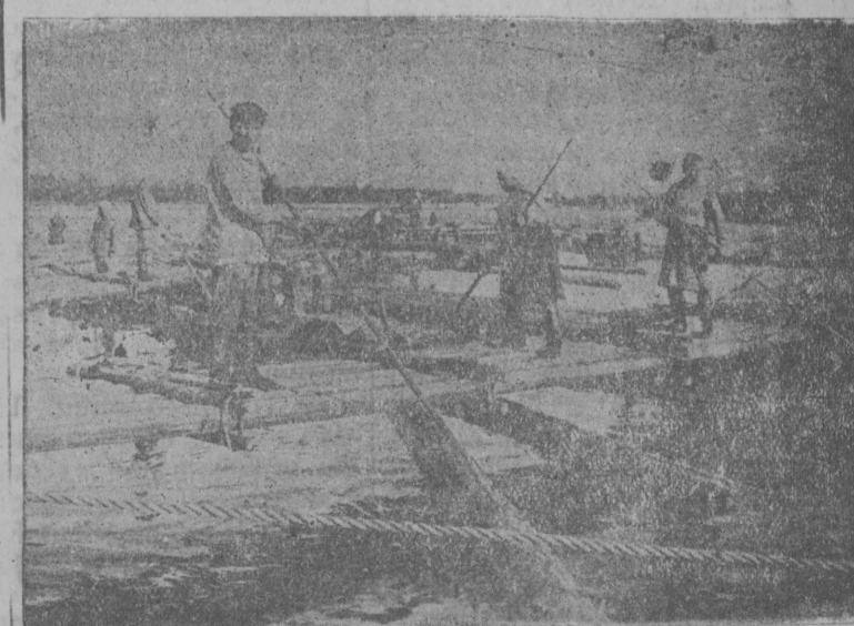
Комсомолец-молодожиёј бригада вёр пурјаланыны.

Тајё лунјасёв Сыктывкарса кујим комсомолецкёй первичној организација берды котыртысёны партијалыс исторјасё первоісточникјас куё велёбёны вылё кружокјас.