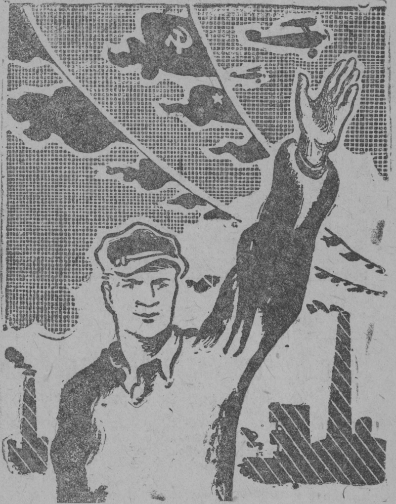
Рабоче-крестанскōј Красној арміяын ме лōа достојнōј бојецдн!