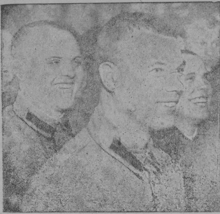
Красноармеецтас театрын виждооны спектакл.