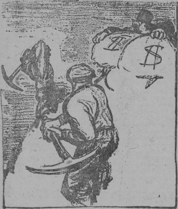
Вождь, пролетаріјас! Капитализмōс жугдōм вōсна!