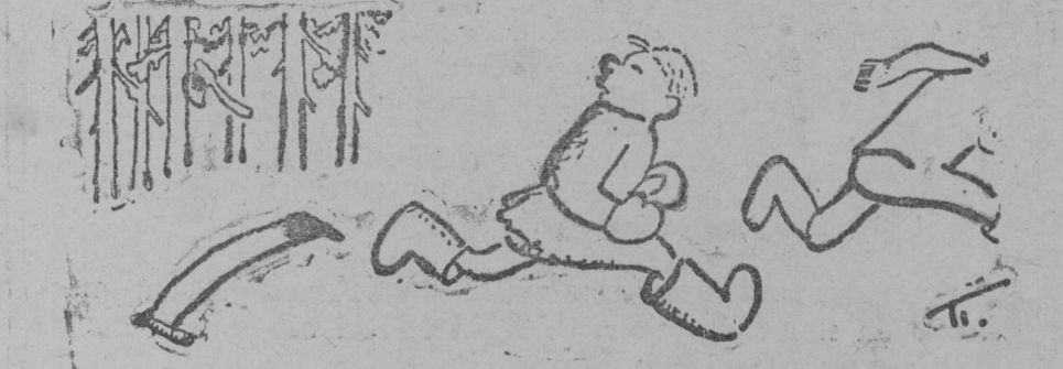
Рисунөк худөҶнөк Пөльаковлөң.

Герпас ылаын: карса комсомолскөј организацијаыс вөрө мөдөм комсомолөчјас пөвсыс унаөң вөр вөсна сталинскөј поход „нүөдөны“ уҶ ылаын пышјалөмөң