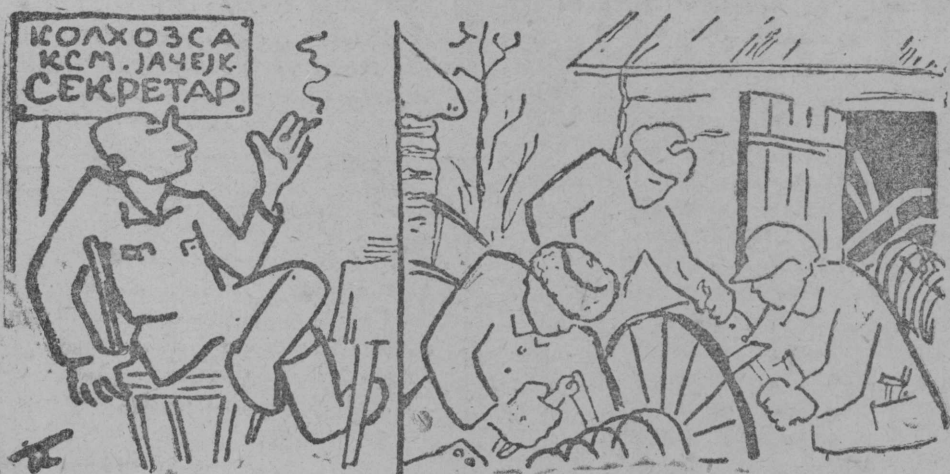
Рисунок художник Полаковлон (лбсбдбма Заболоцкој текст серти).

Серпас вылын: Унжык колхозној јачејкајасын секретарјасыс пукалбны кабинетын да бостны лунуж. Ои мијан сещбм секретар-јасыд оз ков. Кыци правило, секретарлы колб ужавны производство вылын, бригадаыи.