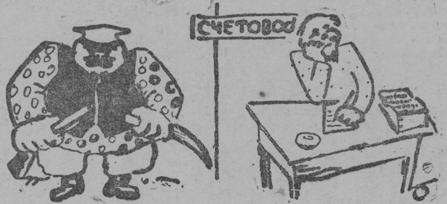
Рисунок художник Полаковлон. (лбсбдбма Заболоцкој текст серти)

Серпас вылын: Унаыс кулакбс корббны кушбмбс гижисны пла-катјасын. Ои сещбм кулакыд абу-нын, сјјб вежбма асыс маскасб. сујбма колхозб (счетоводјасб і мукбд ужјасб).