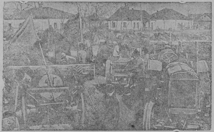
ГЕРПАС ВЫЛЫН Јөнін Косөор „Андре Марти“ да „Первөј мај“ нима колхозјалөм мөінг му вылө петтөз (Голопристапскөј рајон, Украина)