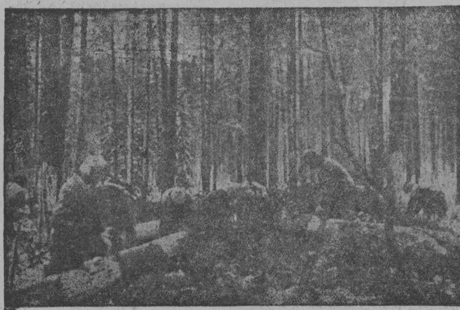
Šerpəš vьlən: Kolegov jortlən udarnəj brigada vəčə vəg.