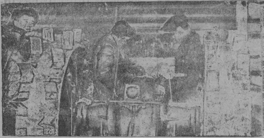
Клыше вылын: Мутницаын "Х-во Коми областлы тыран лун" нима шабди вөдитан совхозын ремонтіруйтөны тракторјас гөра көза-кежлө,