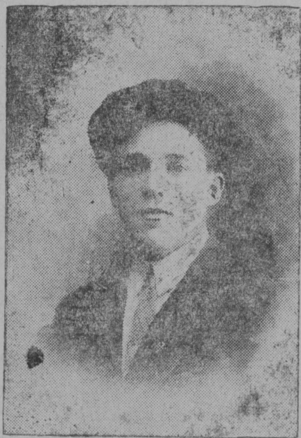
ЦРК бердса ВЛКСМ јачејка политшколаын ужалыс пропагандист—Лапін јорт.

ВЛКСМ Горкомөсө культуроплы колө сетны отсөг пропагандистјаслы, колө мијанөс чукөртавлыны, колө сетны програмјас, индөвны литература с. в.