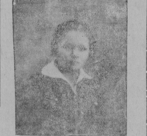
Комсомолка Прокушева жорт, код и аслас возмöсчöмөн отсалö ичöт опыта вожатöд-јасын.

јас да ыплöм-јас; ыланкыв—„мы веселыжö ребјата“, „жуныј барабанщик“, ворсөм-јас: „так и етак.“