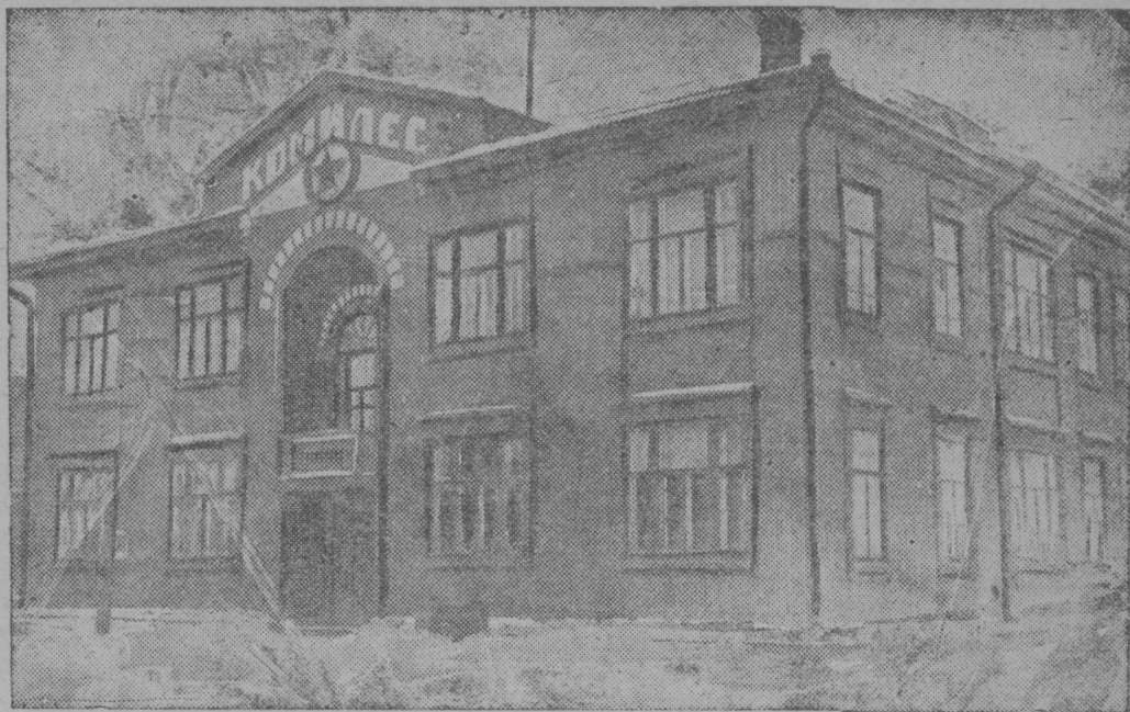
Сыктывкарса леснөј техникүм.