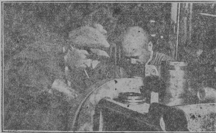
Герпас вылын: (шуйга вылын) ВЛКСМ ЦК-лөн генеральној секретар Көсарев јорт да ВЛКСМ бјуро ЦК-ыс шлен Лөженер јорт Сталинградскөй тракторној заводын прорыв штурмујтөгөн.

ВЛКСМ ЦК-ыс Генеральној секретар Көсарев јорт