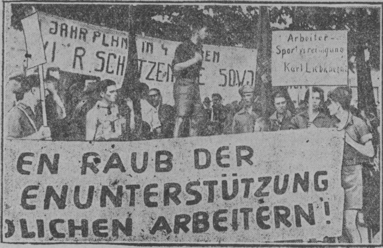
Герп'ас в ылын: Њејкѓрхенын муніс Австријској комсомоллѓн слѓт, слѓт в ылын в ѓлі 1000 морт сајѓ.