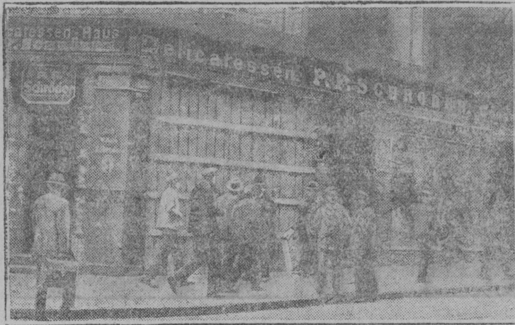
Серпас пылын: продовольственној магазін Гамбургын, пазөдөма шыгјалыс ужтөм јөзөн.