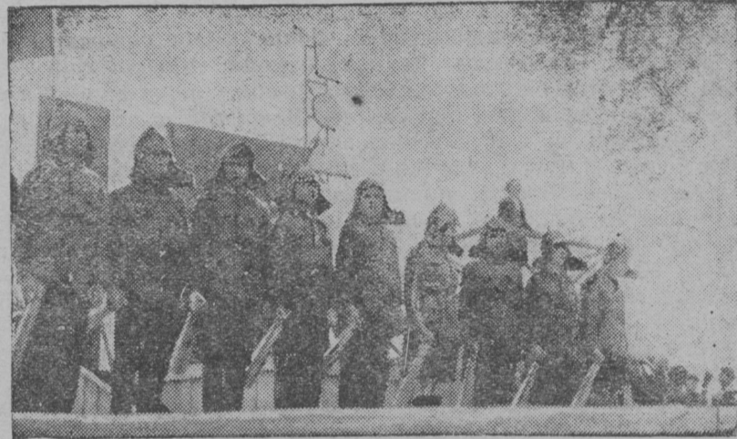
Затӱјникјас МЈУд лунӱ Сыктывкарын.