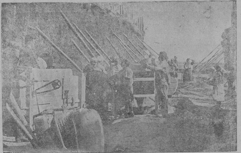
Герпас вылын колхозын вартөны