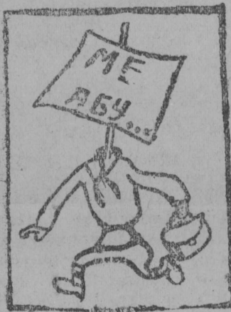
Виқинса рајбјуро ЈУП.

Пионер отрадјасын уж оз мун. Комсомол јачеј-најас вунөдөмаде зөлажык вокјассө