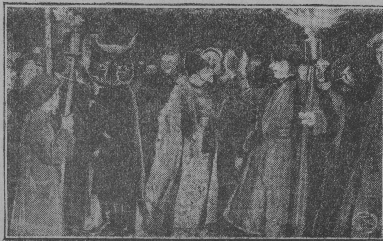
Герпас-вылын: Јенлы ескöмкöд вермаган карнавал Мöскуа-ын „Поп“ да „чöрт“ щöктöны безбожыкјасöс празнујтны „ыжыдлун“.

— Тајö-нö кодлон тащöм лок пощöсыс? — Те-нö он-і тöд. Комсомол јачејкаса секретарлөн. Сіјö кабала-нас тырöма-да, оз вермы петнысö сы-улыг некущöм уж-вылö. — Кущöма-нö тіјан јенлы ескöмкöд вермаган ужыд мунö? — О, мијан! Төнқи комсомолчјас став жыңнан көвјассö көлöкбл-нычаңг нещкисны. Сусöө најö, дру-гö, нинöм-і шуны.