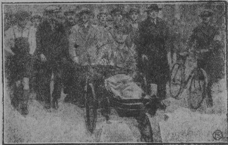
Герпас-вылын: Комсомольчяслөн колонна.