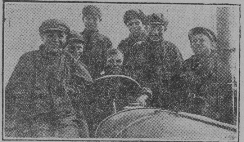
„Бенардакі“-һыма совхозын (Пугачевса округ, Улыс-Волгаса крај) организујтисны фабзавуч школа. Сөні велдөоны тракто-рөн ужавны.