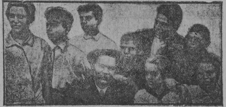
Максим Горкиј Мбскуаин.