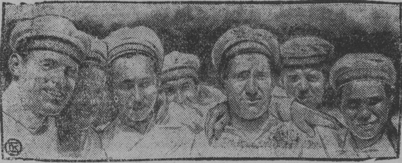
Серпас-вылын: Бауманса осоваіахімын морскей кружокса шлен-жас-комсомолечјас пагсаёмабе моракјас паскөмөн.