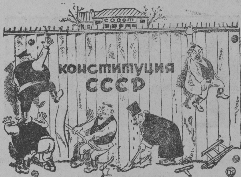
Бёкыд лое жугёдны таё пощёсё.