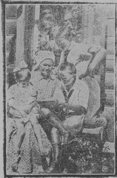
Округувса ылот вылө Ивано-Вознесенскө воасны 200 делегат. Робочейјас көсөны најөс ылот дырјіыс віңны асланыс патерајасын.

Герпас вылын: Піонер штабса дружіньнік гјалө адрессө робочей сөмјаслыс, кодјас көсөны лезны патераө делегатјасөс.