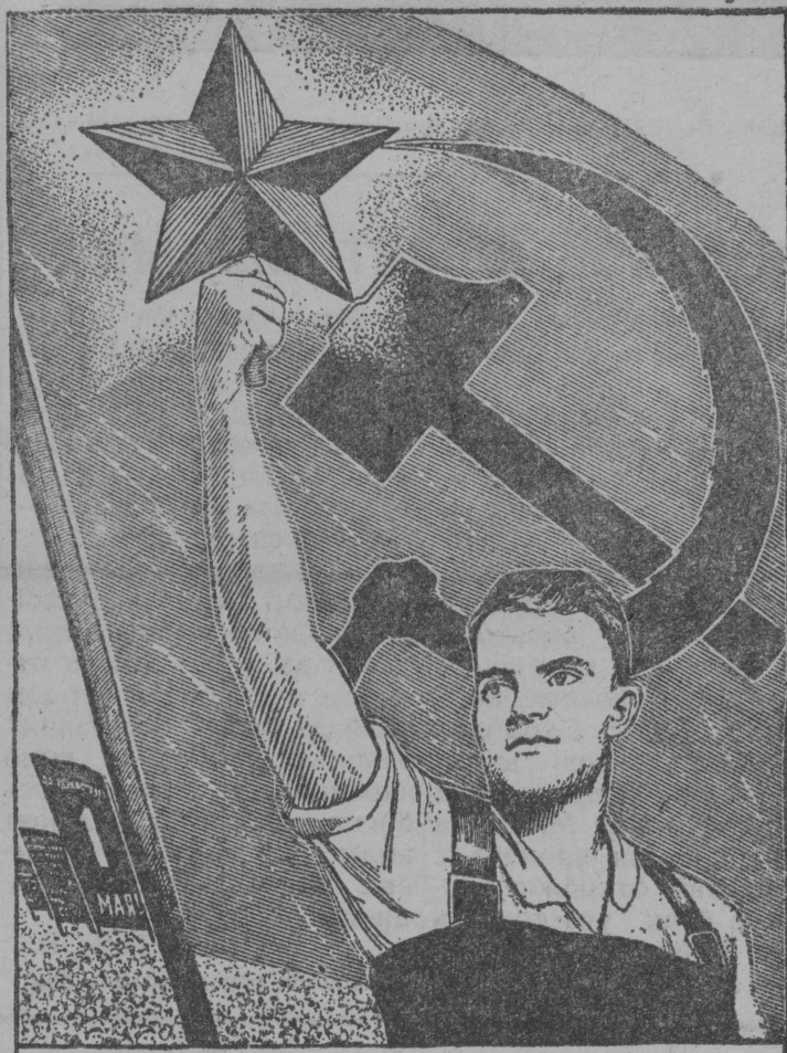
ПРОЛЕТАРИИ ВСЕХ СТРАН, СОЕДИНЯЙТЕСЬ!