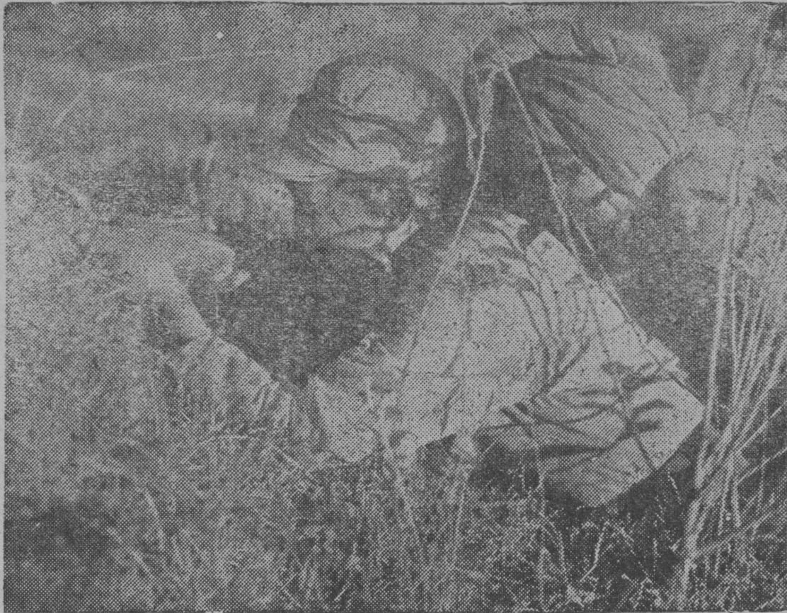
Китайын военнй действеяс. СНИМОК ВЪЛЫН—китайскй армияса боец передовой позицияяс вылын.

Кылдчысь массаясбс ВКП(б) XVIII-д съезд материалъяс да Сталин ёртлбн историческй доклад гбгбр мобилизуйтмдн, Коймд Сталинскй Пятилетка нима Ставсоюзса социалистическй ордысыбм да стахановскй движение котыртомдн аскадын да нбти вошбмъястбг эштбдам кылдчан уджъяс. Челпанов.