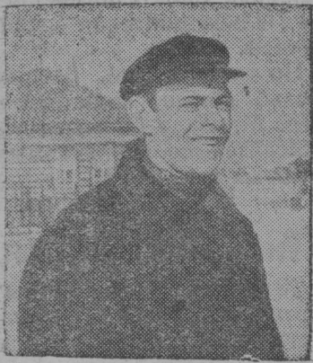
СНИМОК ВЫЛЫН: Литвинов нима колхозса (Свердловскбй область). Ф. И. Балакин, кодб колхозын вескбдлб 1931 восянь.