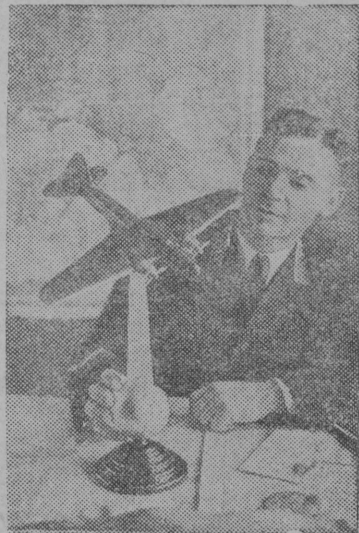
Снимок вылын: (шуйгавылын) „Москва“ самолөтса командир Советской Союза Герой В. К. Коккинаки аслас квартираны видлалө Менжинский нима заводса коллективльсь подарок— „Москва“ самолөтлысь пакет. Воськыдвылын: „Москва“ самолөт Мискоу дэ вылын.