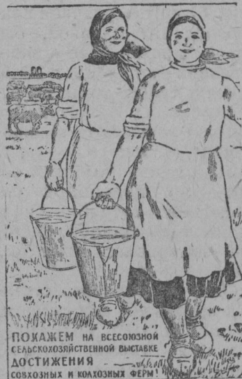
ПОКАЖЕМ НА ВСЕСОЮЗНОЙ СЕЛЬСКОХОЗЯЙСТВЕННОЙ ВЫСТАВКЕ ДОСТИЖЕНИЯ СОВХОЗНЫХ И КОЛХОЗНЫХ ФЕРМ!

Ивановской Меланжевой комбинатын соститчис кык вося стахановской школа лөн медв дза выпуск. Школасö помалисны 122 морт. Уна выпускникöс выдвинитöма руководящей уджясыс вылö.