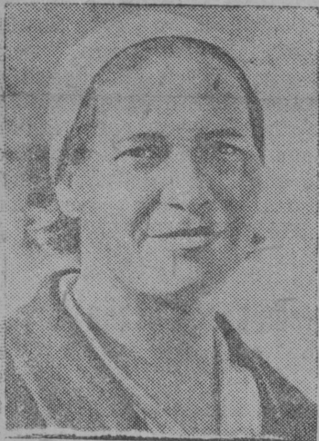
Снимок вылын: А. А. Кулешова—Буденный нима колхозса (Московской область) лысьтысь.

А. Ф. Безносикова. Молотов нима колхозысь колхозница-стахановка.