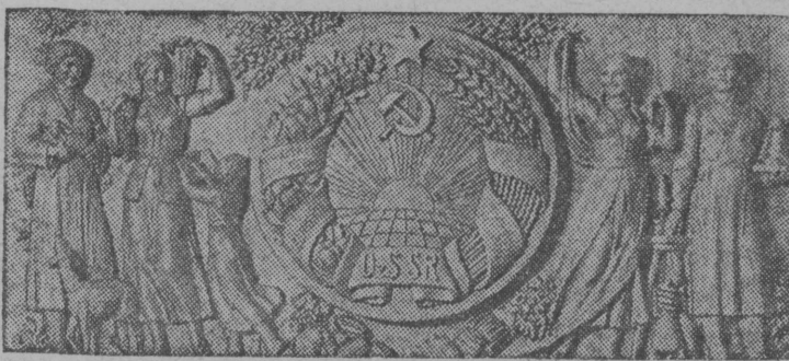
СНИМОК ВЫЛЫН: Нью-Йоркын Международной выставка вылын СССР павильонса барельеф „Узбекской ССР“ (эскиз).