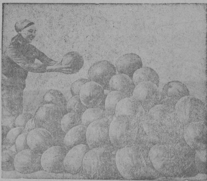
СНИМОК ВЫЛЫН: Сталин нима колхозса (Сталинградскѳй область) (борщица М. И. Рябухина арбуз чукѳр дины, кодѳс лѳсьѳдѳма модѳдны промышленной центрясьѳ.