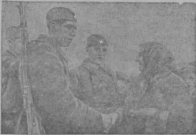
СНИМОК ВЫЛЫН: Западной Белоруссияса (местечко Молодечно) крестьянка приветсуйтб боецьясбс да командирьясөс.