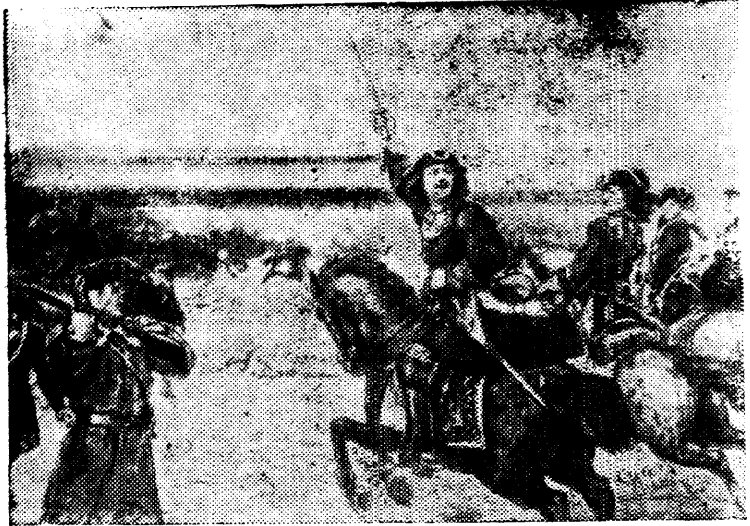
На снимке: репродукция с картины И. Репина «Полтавский бой».