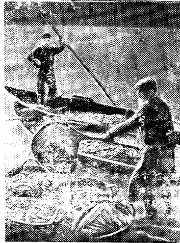
Куйбышевская область. Рыболовецкие колхозы, входящие в зону Куйбышевского рыбного завода, соревнуются за выполнение годового плана улова рыбы к 7 ноября.

Комиссия по проведению празднования 31-й годовщины Великой Октябрьской социалистической революции.