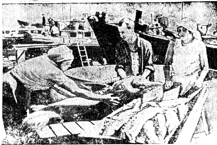
ДАГЕСТАНСКАЯ АССР. К пристани «Большой Лопатин» припартовались рыболовецкие суда с богатым уловом. Идет потребление рыбы и выемка икры.