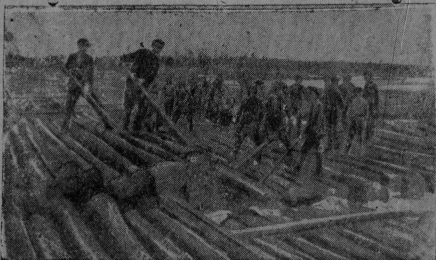
Бырӕдамӕ ударнӕј ужӕн прорывјас!

Комі областувса парторганизација, партија Крајком вескӕдлӕм улын, сылы большевистскӕј индӕдјасӕ олӕмӕ пӕртӕмӕн регыдја кадӕн петас прорывјасыс став кӕџајственно-политическӕј мојјас олӕмӕ пӕртӕмын сувтас медвозза радјасӕ ылаӕ Војвын теныс большевјкјас пӕвсын.