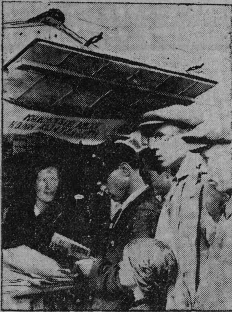
Сыктызкарын кнїжнõй кїоск.

комі областõ востыны велõданинјас: Пед техникум Угъвымõ, Сыктызкарõ натсиональнõй рабфак і 1932 воõ востыны педінститут.