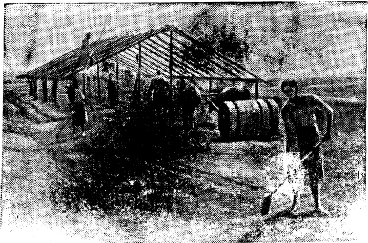
Строительство крытого тока в колхозе имени Калинина Новочеркасского района Ростовской области.