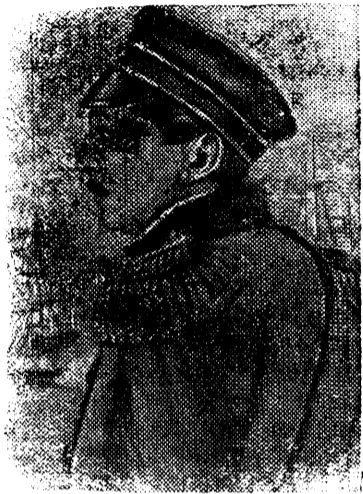
Адмирал Павел Степанович Нахимов. (1802—1855)

(К 90-летию со дня смерти, 12 июля 1855 г.—12 июля 1945 г.)