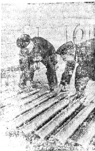
Краснофлотцы крейсера А. Г. Хаким и П. П. Коваленко готовят снаряды перед выходом на боевую операцию.