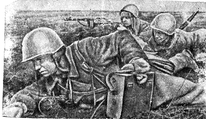
Отважный минометчик младший лейтенант тов. Быков под огнем противника проводит линию связи.