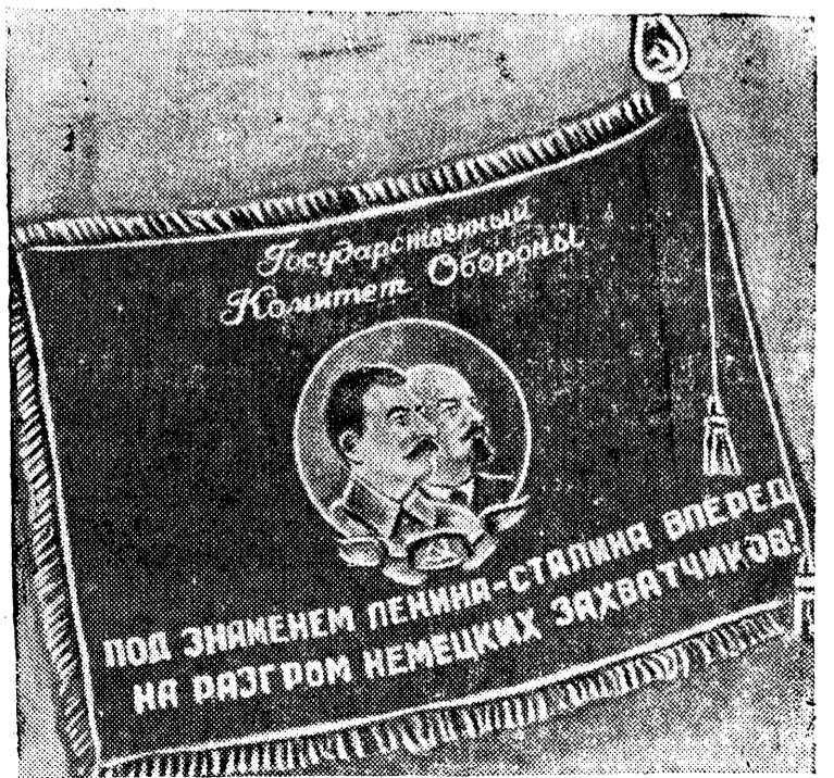
Лицевая сторона Красного знамени для лучшего завода авиационной промышленности.