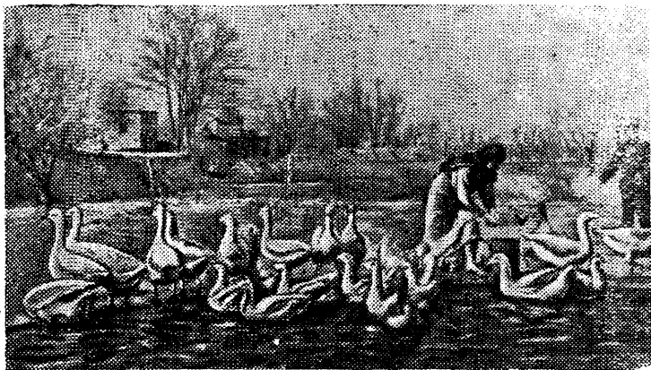
На птичьем дворе колхоза имени Азизбекова (Азербайджанская ССР).