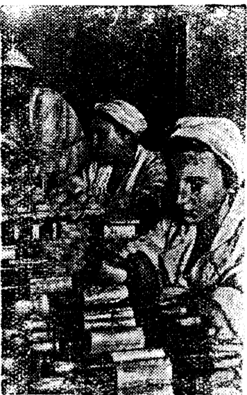
На снимке: Работницы экспедиции за ушаковой кровью для отправки на фронт.

В Центральном институте по переливанию крови (Москва).