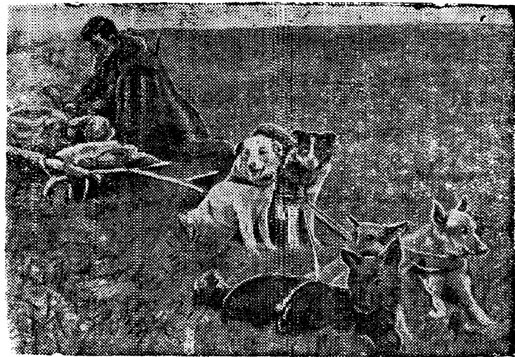
На снимке: Вожатый нартовых собак И. С. Бышев, вывезший с поля боя 45 раненых с полным вооружением.