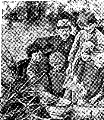
На снимке: Дети колхозников одной из деревень Зубцовского района (Калининская область) у своего «жилища», где им пришлось находиться в дни оккупации.