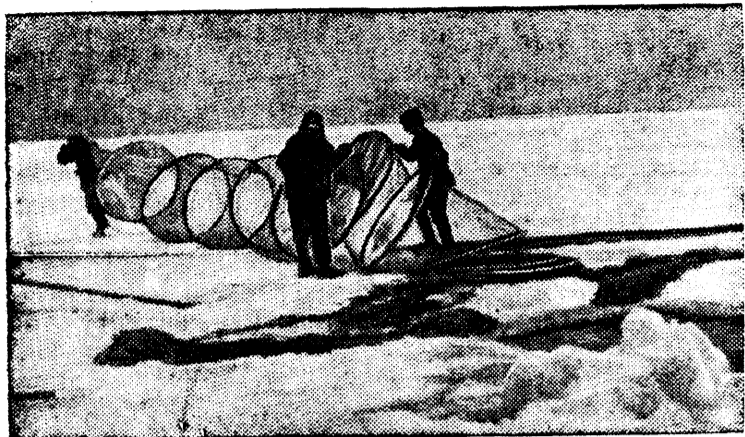
Колхозники рыболовецкого колхоза „Завет Ильича“ (Беломорский район, Карело-Финской ССР) готовят к спуску под лед сельдяную мережу.