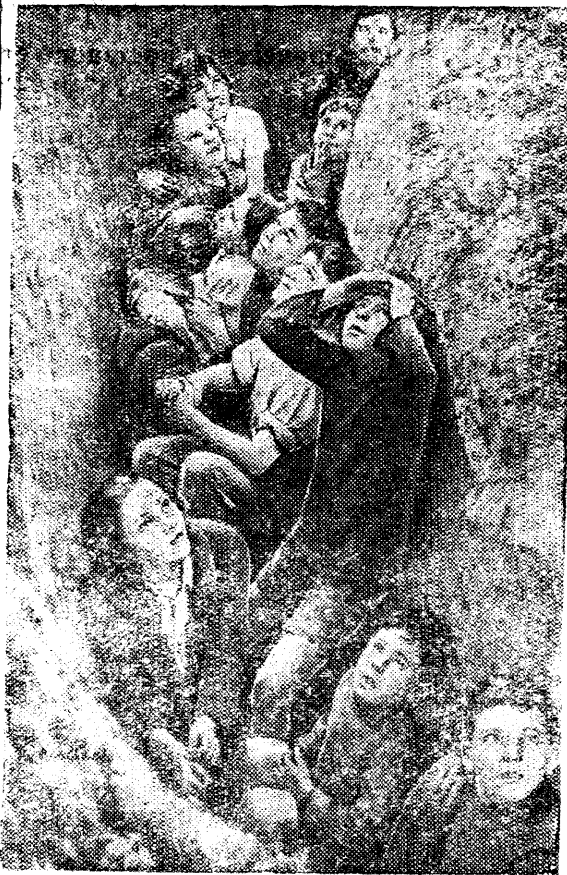
Английские дети наблюдают из убежищ за воздушным боем немецких и английских самолетов.