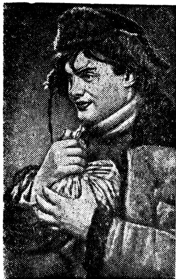
Кадр из фильма. Ленка Сухов (артист Н. Кадочников) привез подарок Якову Свердлову.

На экранах кинотеатров нашей округа началась демонстрация историко-биографического фильма „Яков Свердлов“.