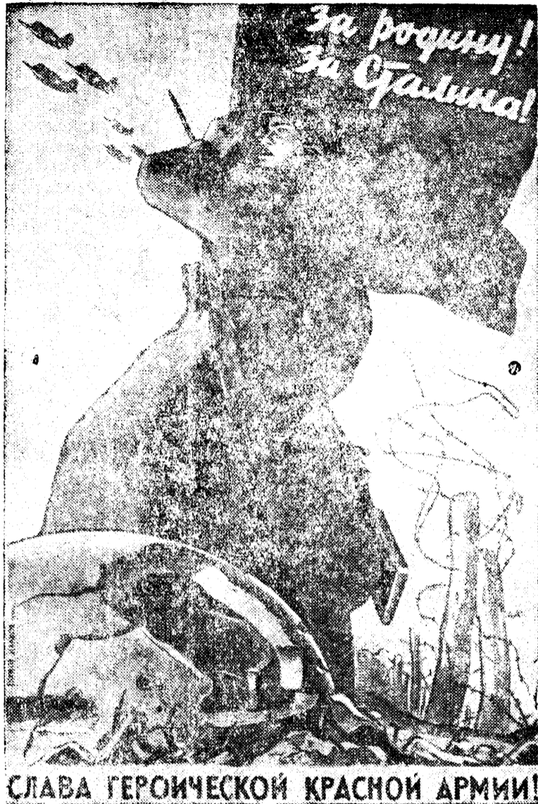
Рисунок художника В. Иванова. (Репродукция с плаката изд. „Искусство“).

Наконец, третья особенность Красной Армии состоит в том, что воины социалистического государ-